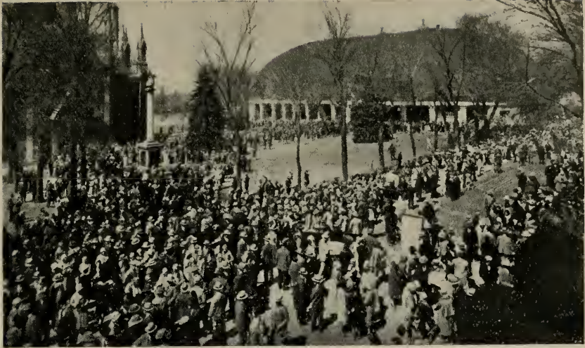
Am Konferenztag vor dem Tabernakel in der Salzseestadt, Utah.

nicht befolgte, verlor das Leben. Er verglich das irdische Leben mit dem nachfolgenden Leben in der Geisterwelt, und die Arbeit, die hier getan wird, mit der Arbeit, die dort zu tun ist, und wie die Macht und Autorität der Diener des Herrn mit ihnen geht in die Geisterwelt, wo sie ihre Arbeit fortsetzen. Er sagte, auch dort sei eine große Zahl Seelen, die das Evangelium auf Erden nicht gehört haben, und grade diesen muß es vor dem großen Tage des Gerichts verkündigt werden.