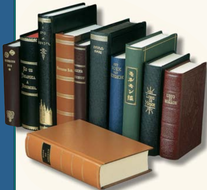
Le Livre de Mormon, dont la première impression date de 1830, est actuellement publié en plus de 80 langues par le monde.

Vous trouverez un récit plus détaillé de l'histoire de Joseph Smith dans Joseph Smith, Histoire dans la Perle de grand prix ou dans History of the Church (Histoire de l'Église), 1:2-79.