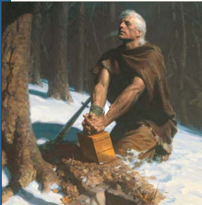
En 421 de notre ère, le prophète Moroni ensevelit les annales de son peuple dans la colline de Cumorah. Lorsque, ressuscité, il revint et apparut à Joseph Smith, il lui parla d'anciennes annales qui contiennent la plénitude de l'Évangile tel qu'il fut donné par le Sauveur aux anciens habitants du continent américain. Ces annales sont le Livre de Mormon.

Il cita aussi le troisième chapitre de Joël, du premier verset au cinquième. Il dit aussi que cela n'était pas encore accompli, mais le serait bientôt. Il déclara, en outre, que la totalité des païens allait bientôt entrer. Il cita beaucoup d'autres passages d'Écriture et donna beaucoup d'explications qui ne peuvent être mentionnées ici.