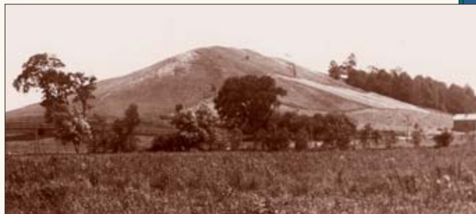
La colline de Cumorah se trouve à environ cinq kilomètres au sud-est de la ferme des Smith à Palmyra (New York). Du temps de Joseph Smith, le versant nord était recouvert d'herbe, le versant sud d'arbres couchés et de forêt. Les plaques étaient enterrées du côté sud-ouest, non loin du sommet. Photo prise en août 1907.

J'avais maintenant l'esprit si profondément impressionné que le sommeil avait fui mes yeux et que je restai couché, accablé d'étonnement de ce que j'avais vu et entendu tout à la fois. Mais quelle ne fut pas ma surprise quand je vis de nouveau le même messenger à mon chevet et l'entendis de nouveau me répéter et me redire les mêmes choses qu'avant ; et il ajouta un avertissement à mon intention, disant que Satan essaierait de me tenter (à cause de l'indigence de la famille de mon