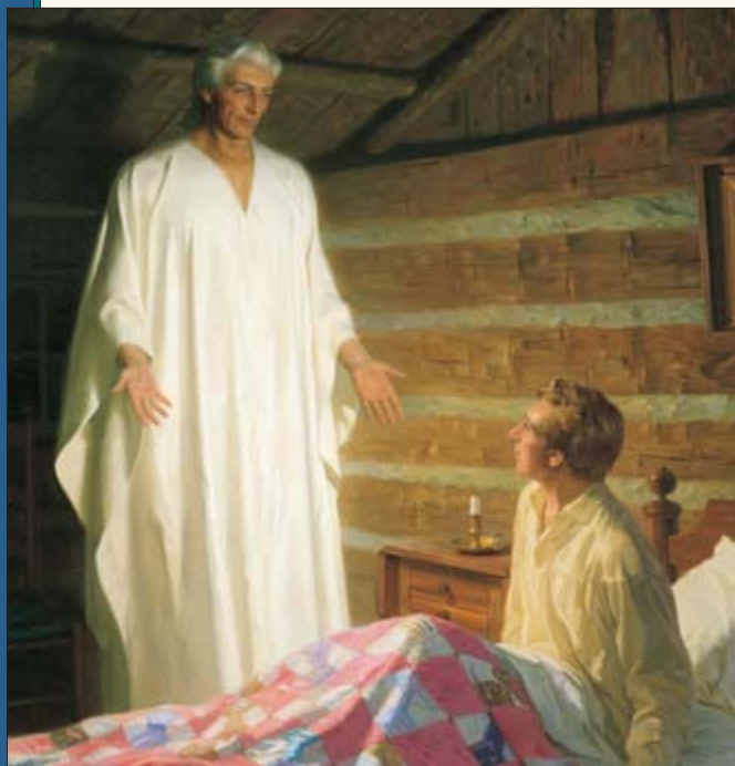
Trois ans après la première vision de Joseph Smith, Dieu envoya l'ange Moroni instruire le jeune homme sur le rétablissement de l'Évangile de Jésus-Christ.

L e soir du vingt et un septembre précité, après m'être mis au lit pour la nuit, je commençai à prier et à supplier le Dieu Tout-Puissant de me pardonner tous mes péchés et toutes mes sottises et aussi de m'accorder une manifestation