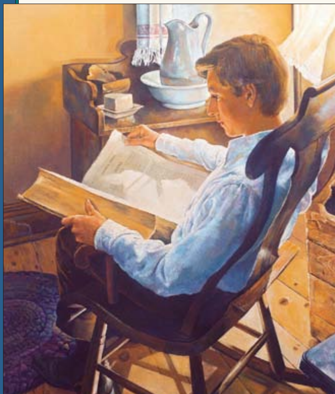
Pour trouver à quelle Église se joindre, Joseph a cherché de l'aide dans la Bible où il lui qu'il devait demander à Dieu.

À partir de ce moment-là, Joseph a oeuvré au service de Dieu pour établir l'Église de Jésus-Christ des Saints des Derniers Jours et édifier le royaume de Dieu sur la terre dans les derniers jours. Les membres fidèles de l'Église témoignent que Jésus-Christ est le Sauveur et le Rédempteur du monde. Aujourd'hui, Jésus dirige son Église par la révélation qu'il adresse à un prophète sur la terre. Joseph Smith était lui aussi prophète. Il