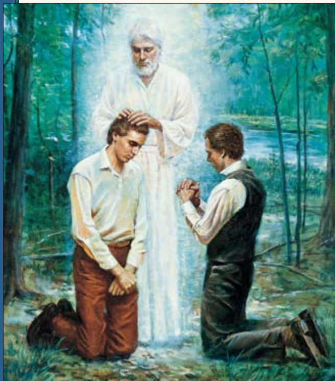
Joseph Smith et Oliver Cowdery reçurent la Prêtrise d'Aaron de Jean Baptiste par l'imposition des mains, le 15 mai 1829.

Nous poursuivions encore le travail de traduction lorsque, le mois suivant (mai 1829), nous nous rendîmes un certain jour dans les bois pour prier et interroger le Seigneur au sujet du baptême pour la rémission des péchés que nous trouvions mentionné dans la traduction des plaques. Tandis que nous étions ainsi occupés à prier et à invoquer le Seigneur, un messager céleste