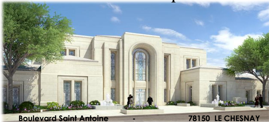
Boulevard Saint Antoine