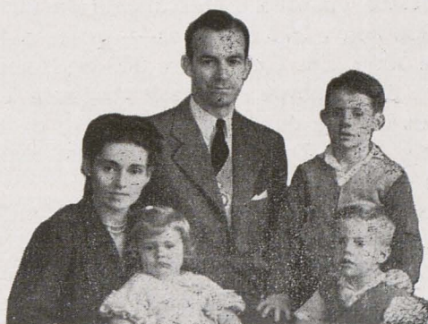
Presidente Rex e família