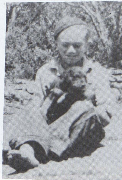
O garoto descalço com seu cão é o Presidente Hinckley aos nove anos de idade

Seu serviço na Junta Geral da Escola Dominical (iniciado apenas dois anos depois de terminada sua missão) deixou-lhe uma constante preocupação com o bom ensino na Igreja, a fim de que os membros realmente aprendam o