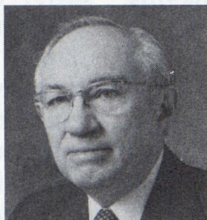
Gordon B. Hinckley