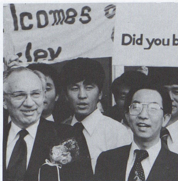
Durante muitos anos, o Élder Hinckley supervisionou o progresso da Igreja na Ásia. Nesta foto, está sendo cumprimentado por membros da Igreja em Pusan, Coréia, em setembro de 1979.

Sua esposa, Irmã Marjorie Hinckley, pessoa igualmente muito capaz, fala do quanto aprecia sua “integridade e lealdade”, dizendo: “Ele jamais hesi-