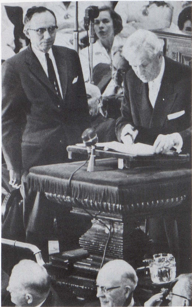
Na conferência geral de abril de 1958, o Elder Hinckley é apresentado no Tabernáculo de Salt Lake como novo assistente dos Doze, pelo Presidente David O. McKay.

“uma combinação singular de conhecimento aliado á compaixão. Sua mente apreende rapidamente os pormenores de qualquer assunto apresentado ao Conselho. Em sua resposta, todavia, a justiça é sempre temperada com misericórdia”. Ele é, diz o Élder Monson “um trabalhador incansável”, demonstrando constantemente “a crença de que se deve procurar em primeiro lugar o Reino de Deus e sua justiça”.