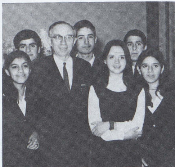
Durante três anos o Presidente Hinckley supervisionou a obra da Igreja na América do Sul. Aqui ele aparece com uma classe da escola da Igreja em Santiago, Chile.