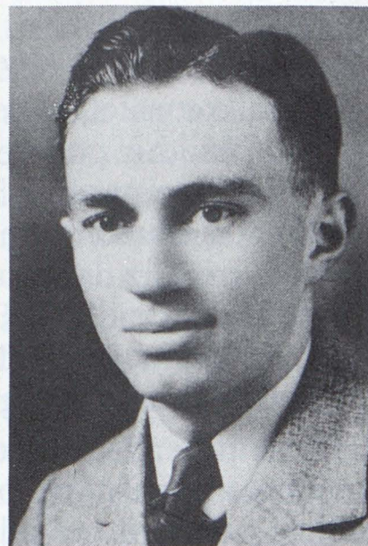
Presidente Hinckley formando-se na Universidade de Utah, 1932.

N a cinzelagem espiritual de uma alma justa, os traços e linhas de experiências precoces às vezes predizem o que se destacará em alto-relevo mais tarde. Os moldes primitivos são muitas vezes surpreendentemente claros, como na vida do Presidente Gordon B. Hinckley, conforme demonstram os exemplos a seguir, cada um de per si uma história de sucesso.