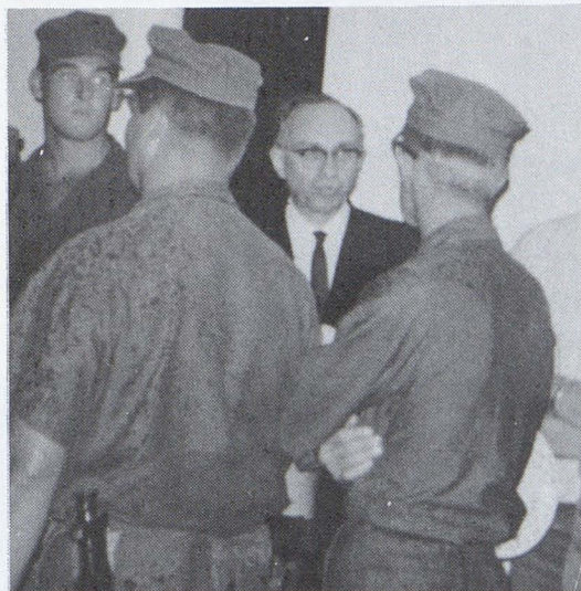
O Presidente Hinckley conversando com militares SUD no Vietnã em 1967.