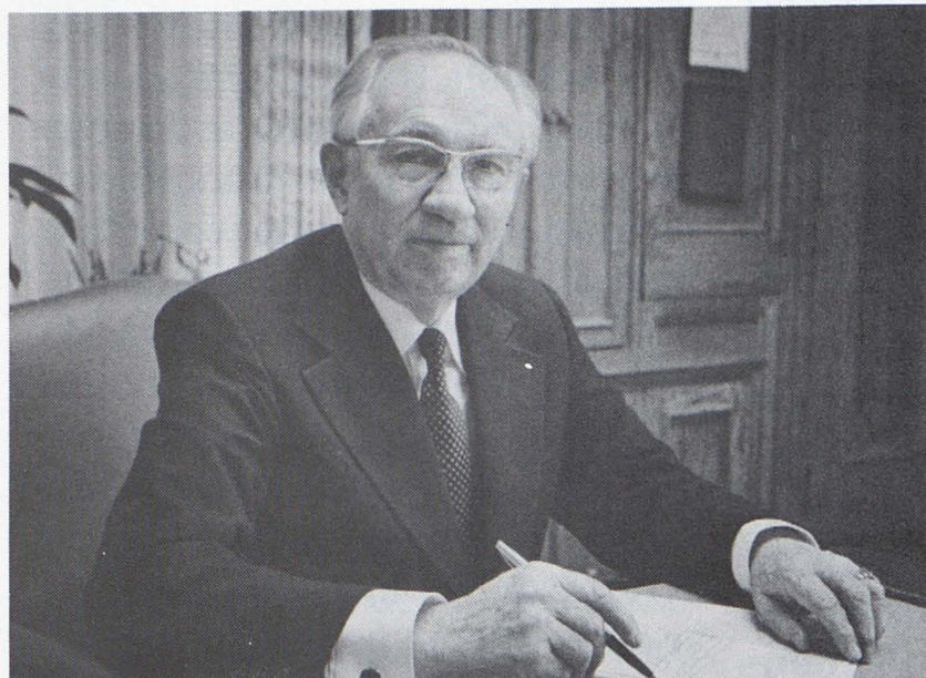
Presidente Gordon B. Hinckley trabalhando em seu gabinete.

por Élder Neal A. Maxwell do Quorum dos Doze Apóstolos