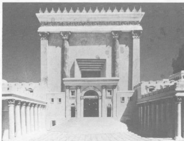
Joël prédit la destruction du temple

La vigne et le figuier, qui comptent parmi les plantes les plus stables et les plus durables qui aient nourri Israël autrefois, représentaient ce que le Seigneur avait donné de mieux à son peuple. Mais ce dernier avait rejeté le don et le Donateur, et tout serait dévasté par les nations innombrables d'invasisseurs qui, comme un lion, ne pourraient être arrêtés. Le lion est celui des animaux que l'on craint le plus, et il tue sa proie avec une grande sauvagerie. On dépouille un arbre en enlevant l'écorce du tronc, ce qui tue l'arbre. L'image était claire. La maison d'Israël serait renversée, ou retranchée, et dépouillée par de puissantes nations extérieures. Ses vignes et ses vergers seraient désolés.