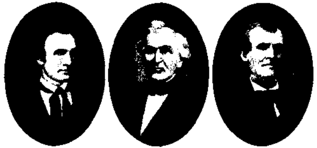
Les Trois Témoins: Oliver Cowdery, David Whitmer et Martin Harris

«Devant ce deuxième échec, Martin Harris proposa de s'éloigner de nous, disant qu'il croyait que c'était