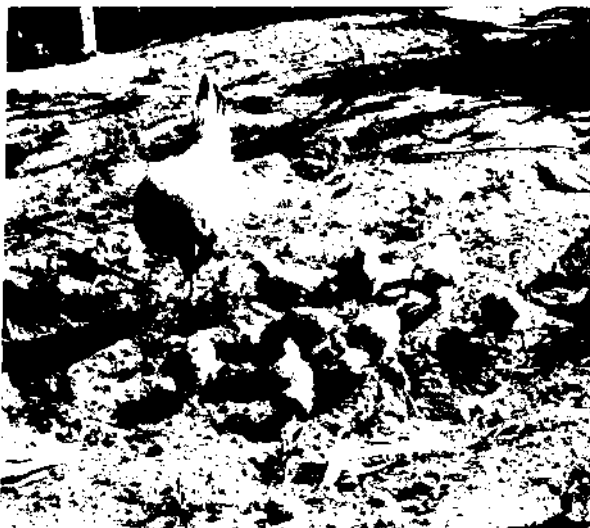
«Comme une poule rassemble ses poussins» (D&A 29:2)

Cette expression est utilisée trois fois dans les Doctrine et Alliances (D&A 10:65; 29:2 et 43:24). Elle