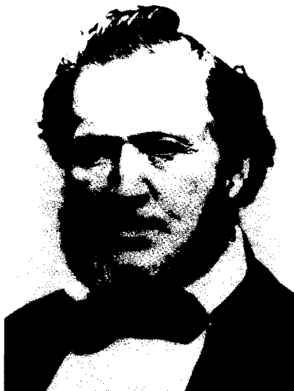
Brigham Young a parlé de la destruction et des calamités à venir

Les éclairs dont il est question au verset 22 ne parlent pas vraiment comme avec des mots, mais constituent autant un avertissement pour les habitants de la terre que celui qui est donné par les missionnaires. Selon le verset 25, le Seigneur utilise toutes sortes de phénomènes naturels en même temps que les efforts des dirigeants de son Église, des missionnaires,