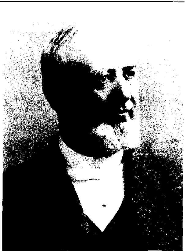
George Q. Cannon a expliqué comment Satan sera lié

Ces deux citations peuvent paraître contradictoires à première vue, mais elles ne le sont pas en réalité. Il est vrai qu'il résulte de la justice des saints que Satan ne peut pas exercer de pouvoir sur eux. Les restrictions qui seront imposées à Satan seront le résultat de deux mesures importantes du Seigneur: (1) lors de sa