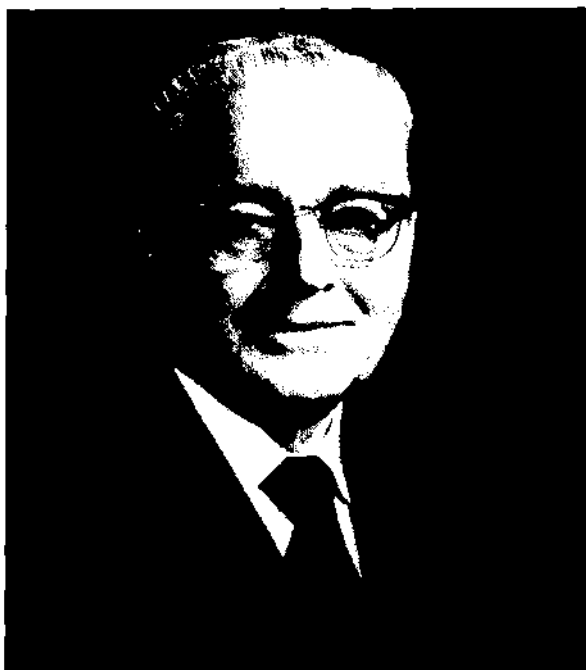
Harold B. Lee a insisté sur le fait que la Première Présidence de l'Église détient les clefs du rassemblement

Les annales de l'Église ne montrent pas qui avait à l'époque la responsabilité d'attribuer les parts en Sion, et à ce moment-là l'Église n'avait pas de Première Présidence officiellement organisée.