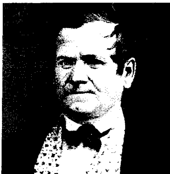
Orson Hyde a consacré le pays de Jérusalem au retour des Juifs

«La prophétie de ce verset s'accomplit littéralement. Orson Hyde proclama l'Évangile de peuple en peuple