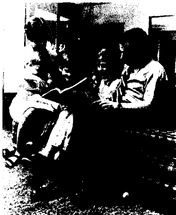
Les parents doivent enseigner l'Évangile à leurs enfants

«Il m'est arrivé de voir des enfants de bonne famille se rebeller, résister, s'égarer, pécher et aller jusqu'à lutter contre Dieu. Ce faisant, ils causent du chagrin à