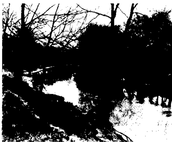
La Big Blue River dans le comté de Jackson, au Missouri

Le président Joseph Fielding Smith a enseigné que «le centre où la ville de la Nouvelle Jérusalem sera construite se trouve dans le comté de Jackson au Missouri. Il n'a jamais été dans nos intentions de substi-