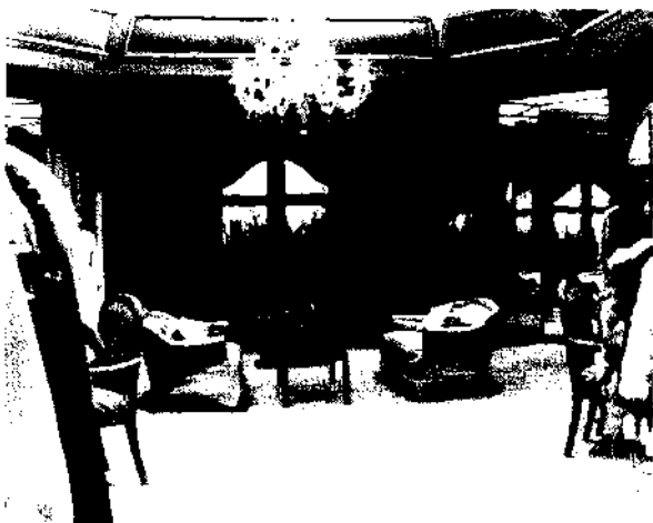
Il est tentant d'acheter à tempérament, mais les saints des derniers jours doivent éviter les dettes comme la peste

reils (ménagers), de meubles, etc. Les achats à crédit sont garantis en hypothéquant nos futurs gains. Ceci peut être très dangereux. Si nous perdons notre emploi ou rencontrons de graves urgences, nous avons des difficultés à faire face à nos obligations. L'achat à tempérament est la manière d'acheter la plus onéreuse. Au prix des produits que nous achetons doivent être ajoutés de lourds intérêts et des frais de dossier.