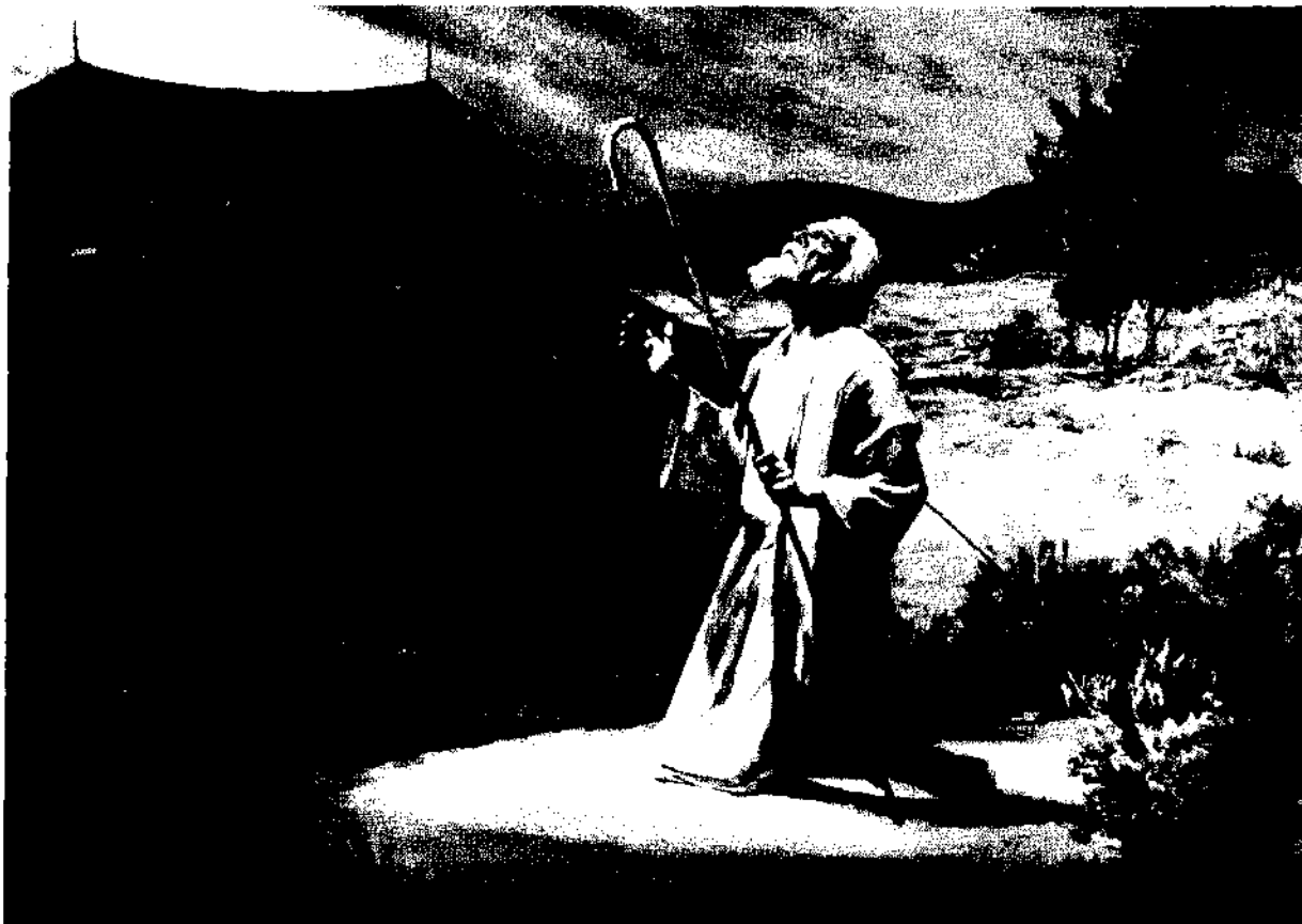
Ceux qui désirent la vie éternelle doivent suivre le Seigneur en toutes choses comme Abraham

Dans ces versets, le Seigneur répond à la question originale du prophète sur le point de savoir si Abraham et les autres patriarches d'autrefois avaient le droit d'avoir des épouses plures (voir D&A 132:1). Le Seigneur commence par dire qu'Abraham est maintenant entré dans son exaltation parce qu'il a reçu fidèlement les promesses et les commandements du Seigneur. Les mêmes promesses sont offertes aux saints modernes et le Seigneur commande qu'eux aussi doi-