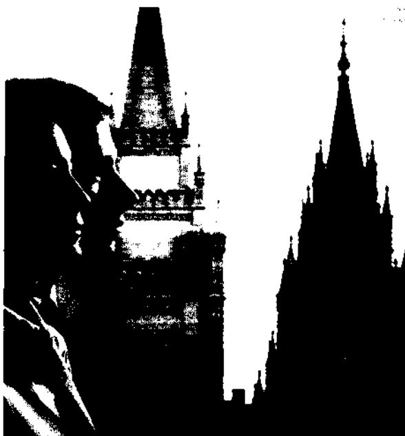
Pour obtenir la vie éternelle on doit garder les alliances que l'on fait dans le temple

«Le verset 26 de la section 132 est le passage le plus déformé des Écritures. Le Seigneur n'a jamais promis à quiconque qu'il pourra entrer dans l'exaltation sans l'esprit de repentance. Bien que la repentance ne soit pas citée dans ce passage, elle est – et elle doit être – impliquée. Il me paraît étrange que tout le monde soit au courant du verset 26, mais il semble qu'on n'ait jamais vu ou entendu parler de Matthieu 12:31, 32 où le Seigneur nous dit en substance la même chose que ce que nous trouvons au verset 26, section 132. . .