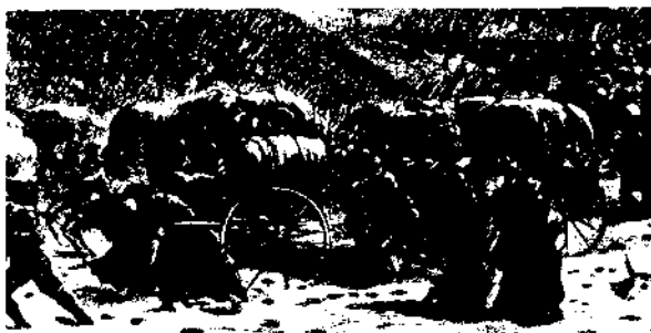
Les saints traversèrent les plaines par compagnies

B. H. Roberts explique les circonstances qui provoquèrent cette révélation : «La tâche importante de préparer la poursuite de la marche dans le désert, la réalisation de l'exode hors des États-Unis, ne fut pas négligée. Elle fut envisagée dans beaucoup de réunions de conseil des autorités présidentes, elle fut le sujet principal de conversation et de discussion chaque fois que deux ou trois personnes se réunissaient. Les réflexions