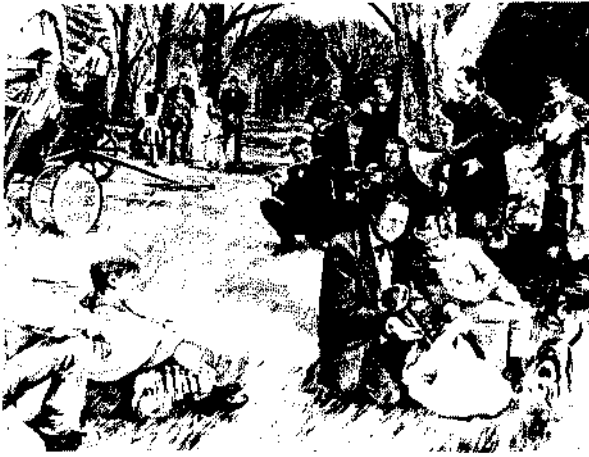
La musique égayait la lassitude des saints pionniers

petit bétail que le Seigneur livra entre ses mains. L'Israël moderne trouva un désert qui ne pouvait être racheté et rendu productif que par un labeur infini.