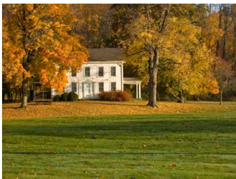
Ferme d'Isaac Morley, Kirtland (Ohio)

Lis Doctrine et Alliances 64:20 en cherchant ce que le Seigneur demande à Isaac Morley de faire de sa ferme. Dans l'espace prévu à cet effet dans le tableau suivant, écris ce que le Seigneur dit à Isaac Morley de faire.