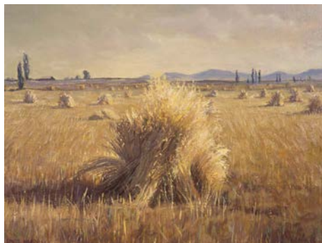
Gerbes dans un champ

En plus de la bénédiction de recevoir les fruits de nos travaux quand nous parlons de l'Évangile aux gens, le Seigneur a promis des bénédictions éternelles dans Doctrine et Alliances 75:5. Comment les promesses du Seigneur au verset 5 pourraient-elles t'inciter à parler de l'Évangile aux gens ?