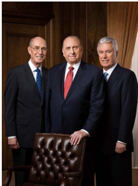
La Première Présidence, 2013

Afin de mieux comprendre ce que signifie le fait qu'un conseiller soit « diligent dans [ses] devoirs de conseiller » envers son président, réfléchis à ce que Gordon B. Hinckley a enseigné sur la manière dont un conseiller doit tenir conseil avec le président.