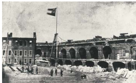
Fort Sumter, dans le port de Charleston, Caroline du Sud

Chaque prophétie contenue dans Doctrine et Alliances 87 a été ou sera accomplie.