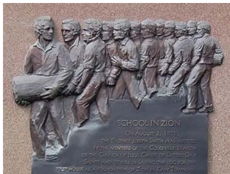
Une école pour les anciens

Si tu devais enseigner à un ami comment être un bon élève, quelles qualités et quels comportements l'inciterais-tu à cultiver ?