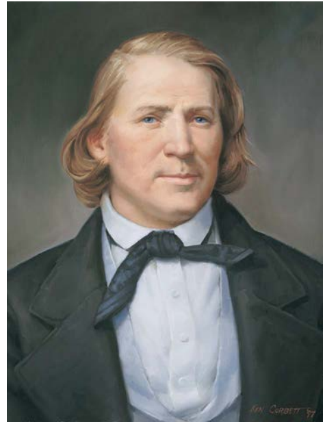
Brigham Young travailla sans relâche pour fournir les ordonnances du temple aux saints avant qu'ils soient forcés de quitter Nauvoo.

Le 3 février 1846, le président Young quitta le temple afin de pouvoir faire les derniers préparatifs pour quitter Nauvoo et partir vers l'Ouest le lendemain. Toutefois, de nombreuses personnes s'étaient rassemblées pour recevoir leur dotation et, par compassion, il fit demi-tour pour les servir. Cela retarda son départ de deux semaines. Les registres du temple montrent que 5 615 saints furent dotés avant d'aller dans l'Ouest. (Voir Histoire de l'Église dans la plénitude des temps, manuel de l'étudiant , Département d'Éducation de l'Église, 1997, p. 305-306.)