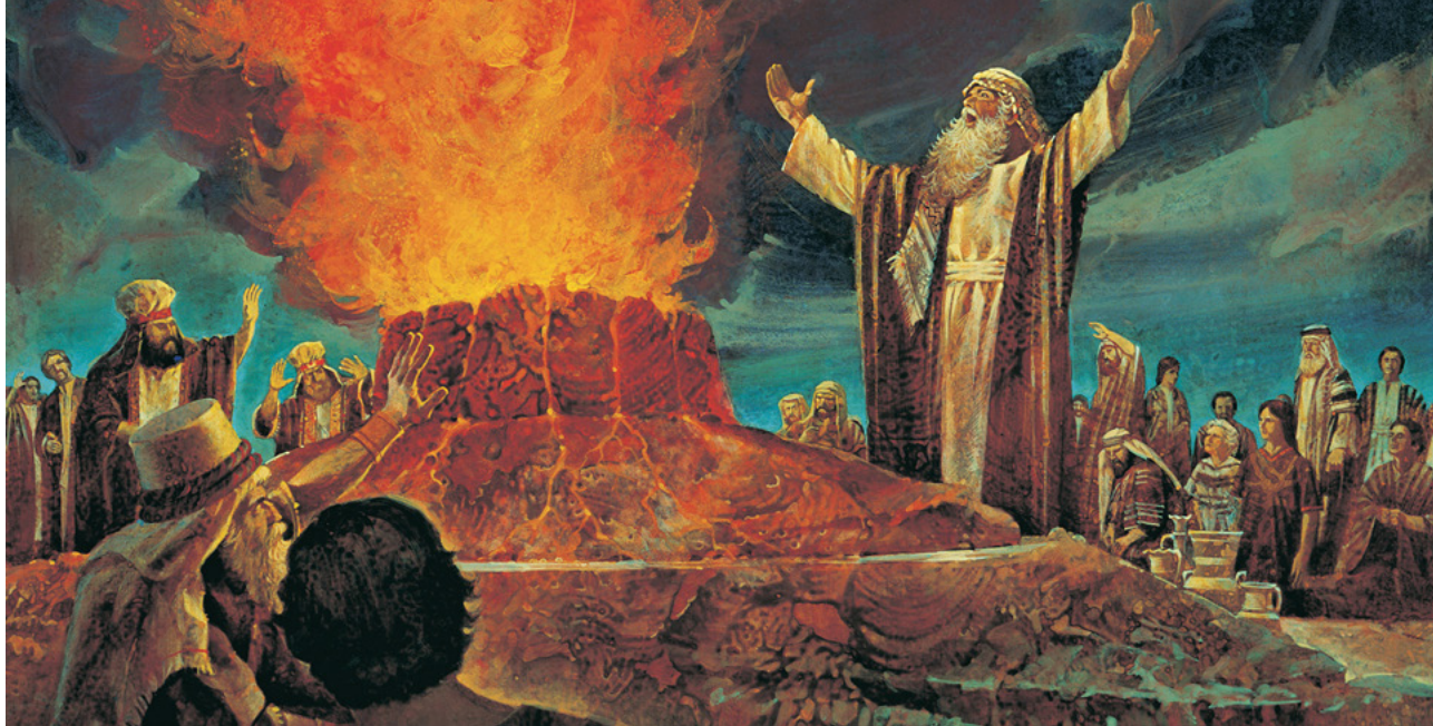
Élie affronte les prêtres de Baal, tableau de Jerry Heiston