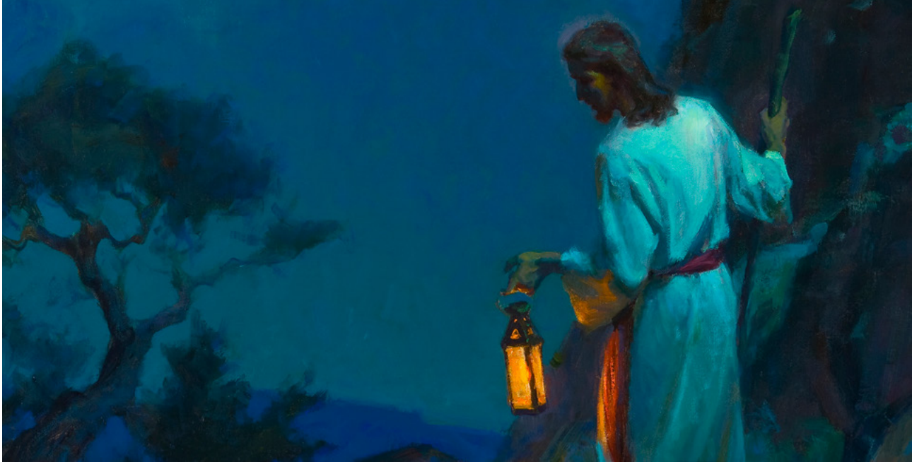
Saving That Which Was Lost (Souverer ce qui était perdu), tableau de Michael T. Malm