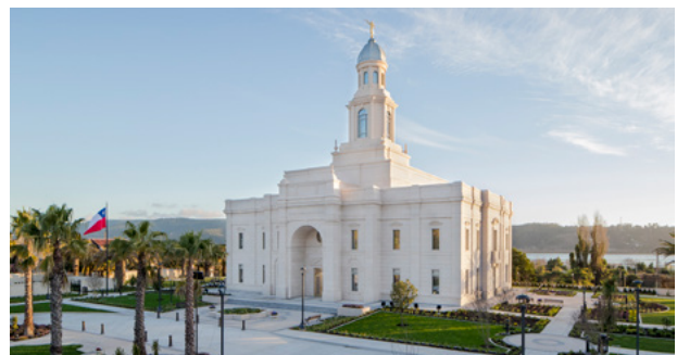
Nous devons être spirituellement propres et purs pour entrer en la présence du Seigneur.

Dans les Psaumes, des mots tels que témoignage , ordonnances , commandements et jugements peuvent se rapporter à la parole du Seigneur. Gardez cela à l'esprit pendant que vous lisez Psaumes 19:7-11. Qu'est-ce que ces versets vous suggèrent concernant la parole de Dieu ? Qu'est-ce que Psaumes 29 vous enseigne concernant sa voix ? D'après votre expérience, en quoi la parole ou la voix du Seigneur correspondent-elles à ces descriptions ?