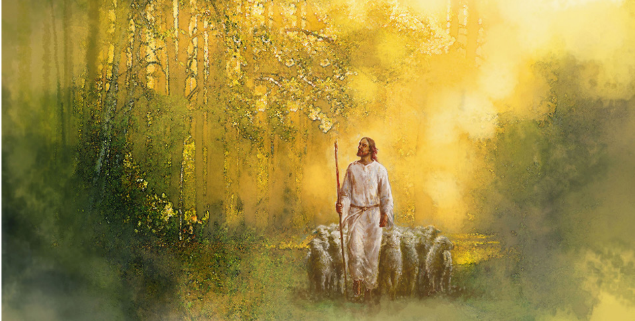
L'Éternel est mon berger, tableau de Yongjung Kim, havenlight.com