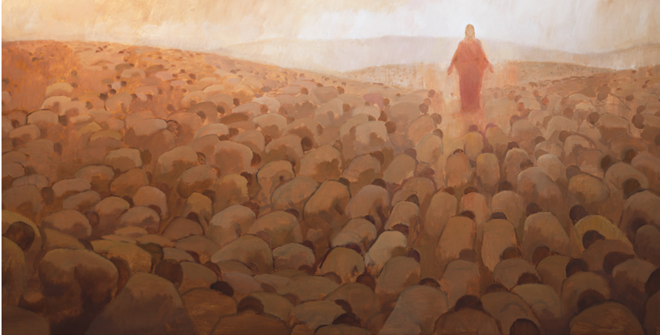
Tour genou/féchyro, tableau de J. Kirk Richards