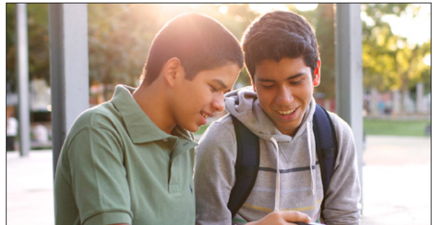
Rendons témoignage à d'autres personnes de ce que le Seigneur a fait pour nous.