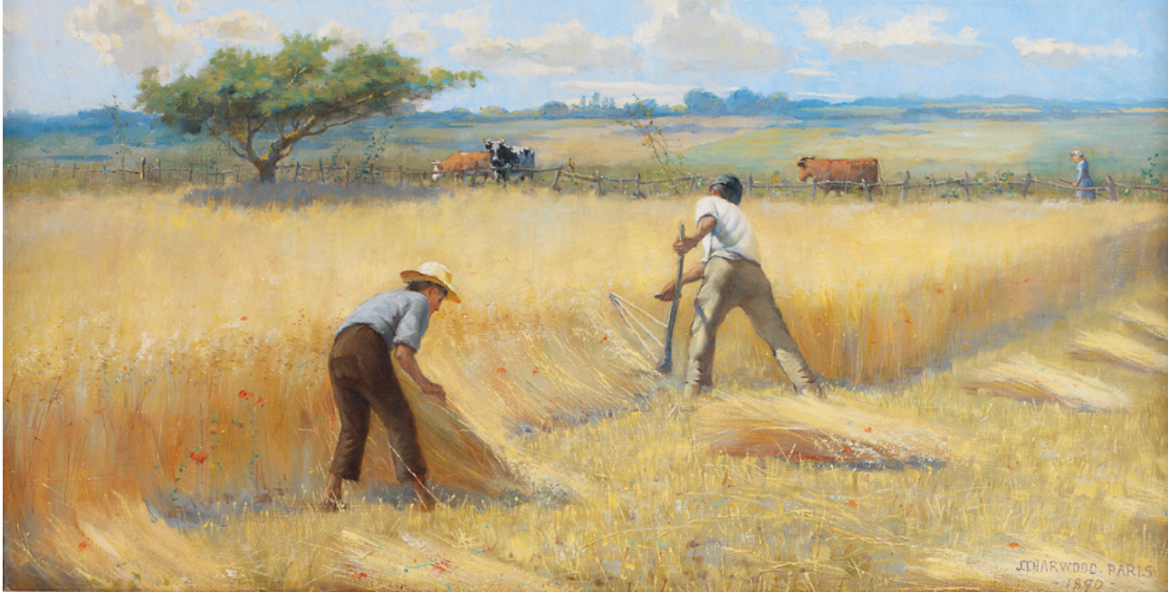
Époque de la moisson en France, tableau de James Taylor Harwood