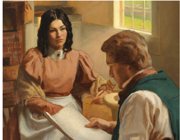
Illustration d'Emma et Joseph Smith

lire des parties. C'était chose courante pour lui. Il est peu probable qu'un érudit eût pu faire cela, et pour quelqu'un d'aussi ignorant et peu instruit que lui, c'était tout simplement impossible 5 . »