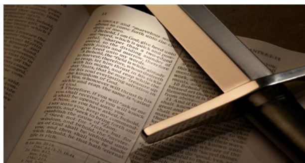
Le Seigneur a comparé sa parole à une épée.