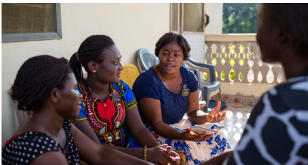
Nous sommes tous missionnaires de l'Église de Jésus-Christ.