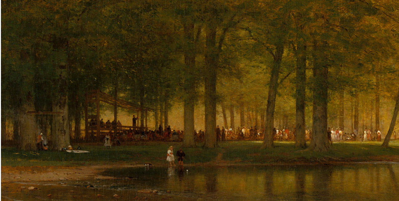
Réunion de camp, tableau de Worthington Whittredge