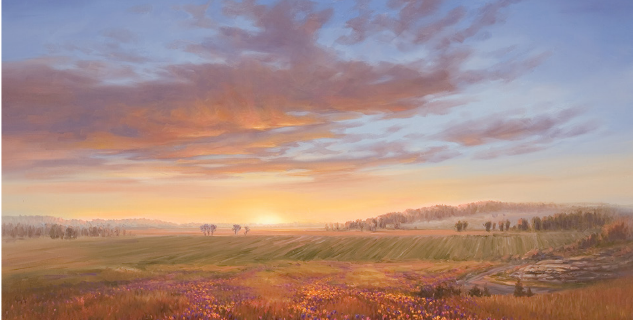
Spring Hill, Comté de Davies, Missouri, tableau de Garth Robinson Oborn