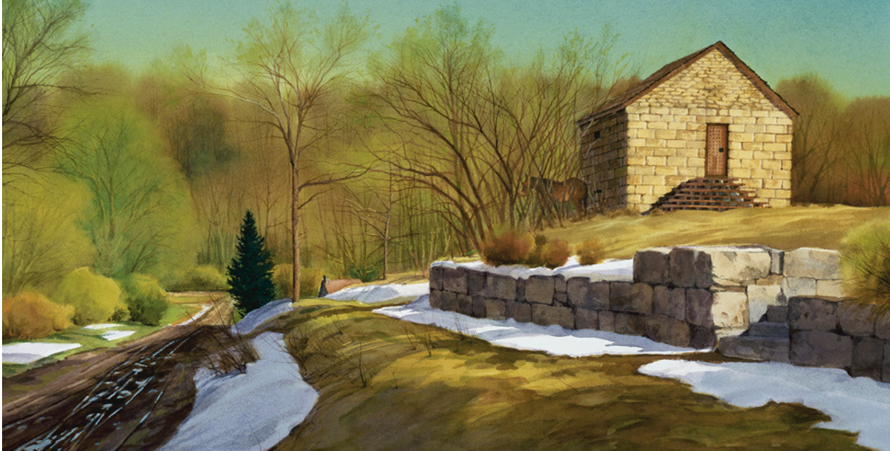
Printemps à la prison de Liberty, tableau d'Al Rounds