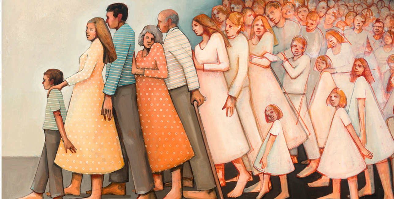
Nous avec eux et eux avec nous, tableau de Caitlín Connolly