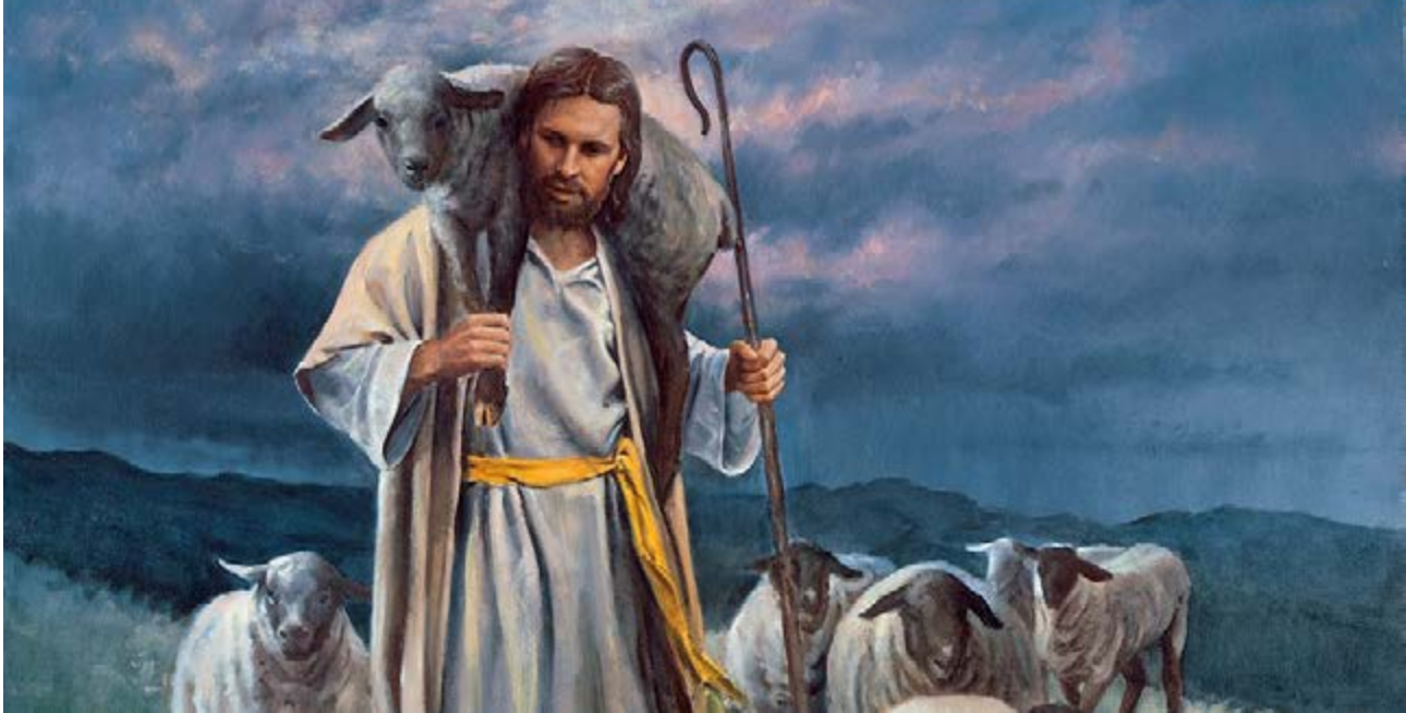
Le bon Berger, tableau de Del Parson