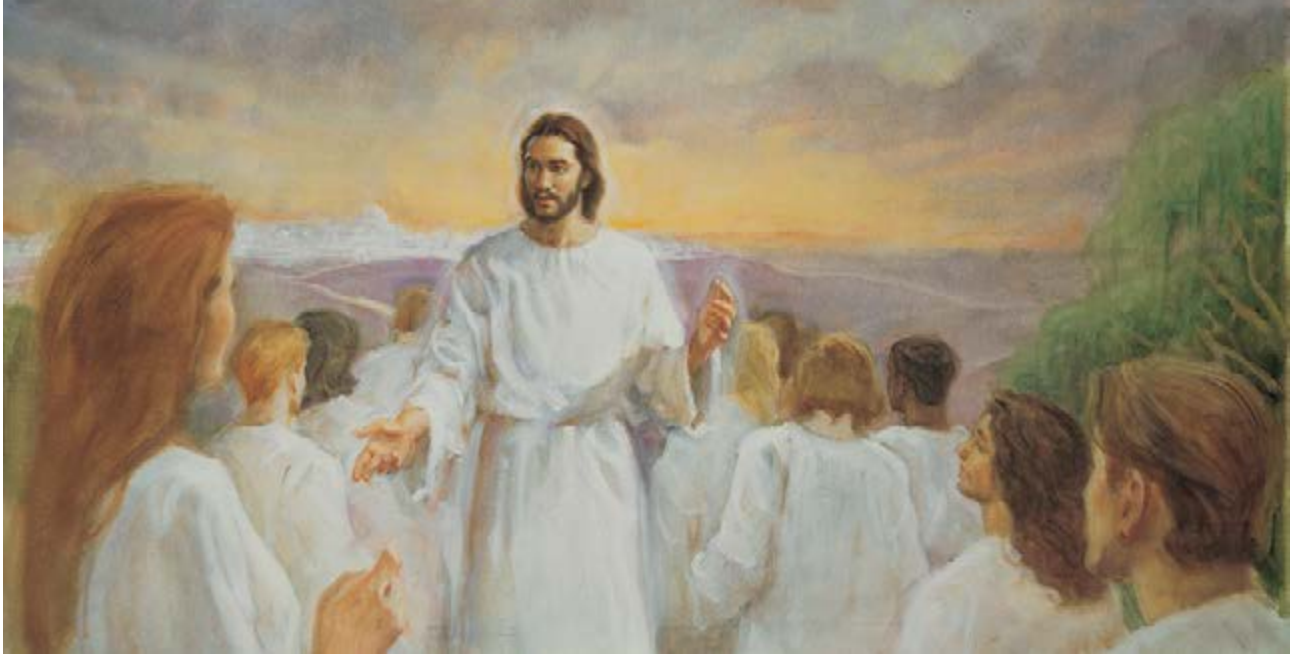
La cité éternelle, tableau de Keith Larson