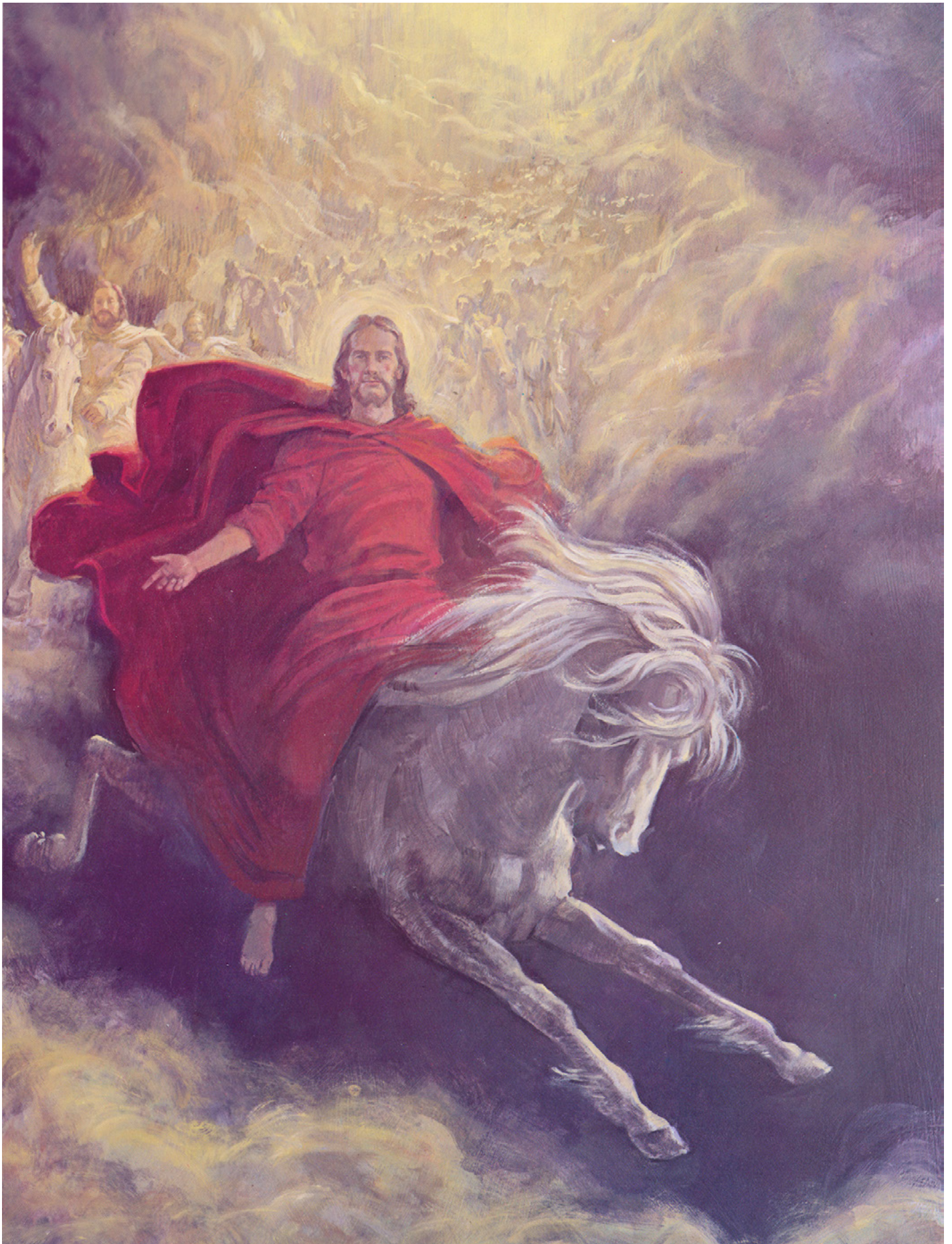
Le Christ vêtu de rouge sur un cheval blanc