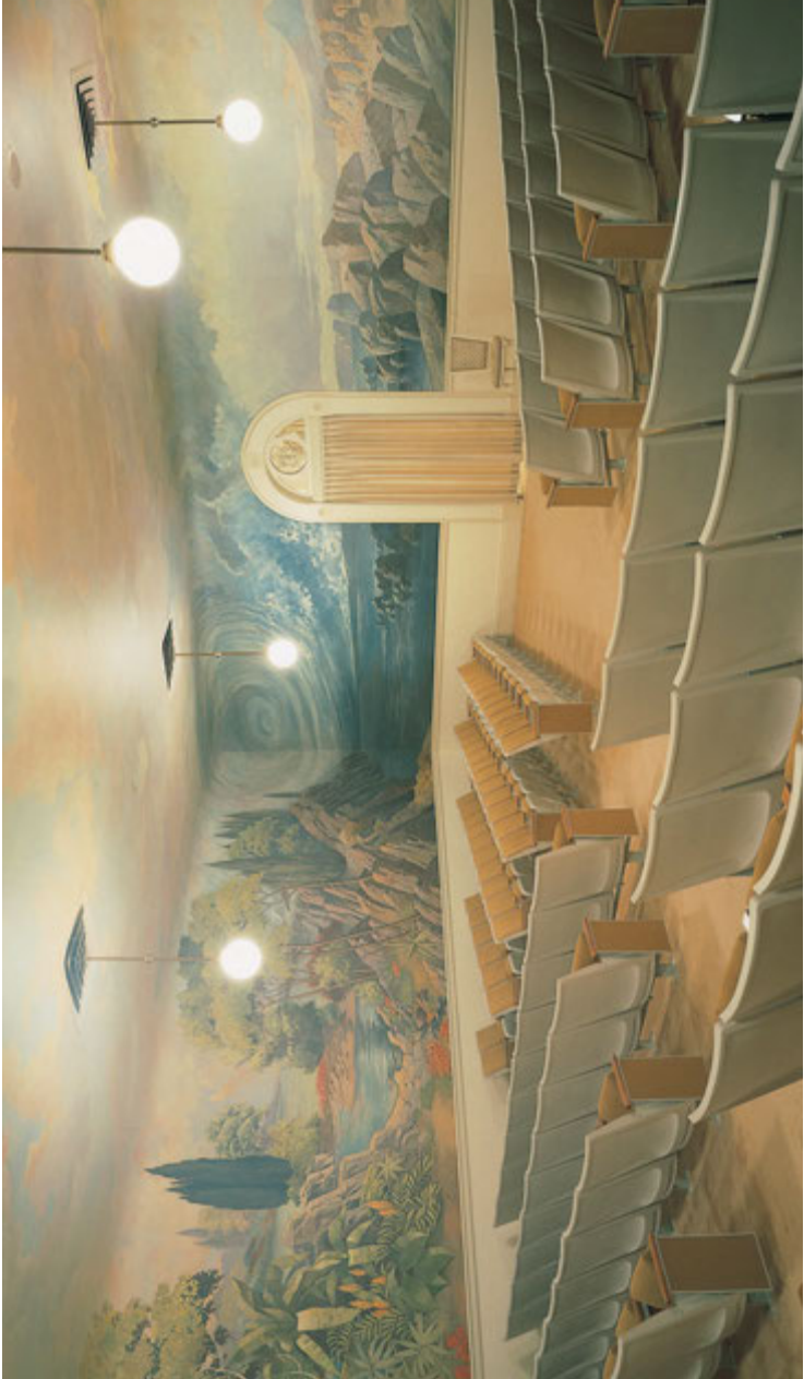
Salle de la Création, temple de Salt Lake City