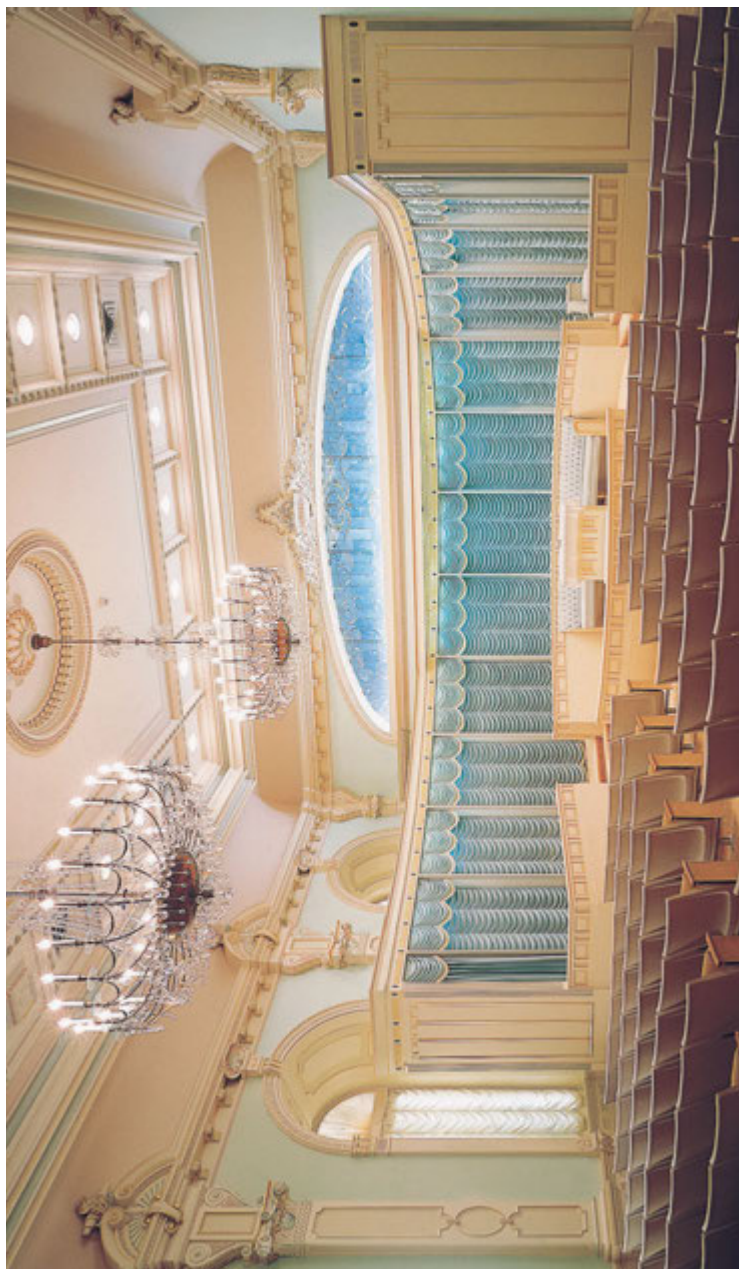
Salle terrestre, temple de Salt Lake City