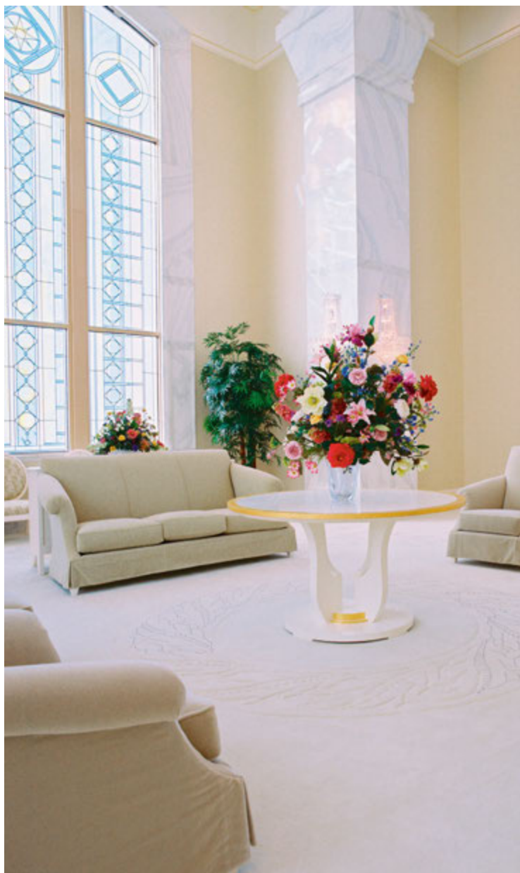
Salle céleste, temple de Columbia River (État de Washington, États-Unis)