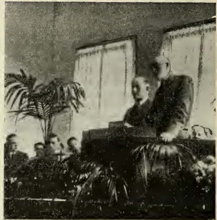
Een profeet spreekt

en van staat tot staat moesten trekken en dat zij tenslotte de beschaving van Amerika zouden moeten verlaten om zich te vestigen in het Rotsgebergte en hij maakte eveneens bekend, dat het geen stad of staat mogelijk zijn om tegen het volk, „Mormonen“ genaamd, op te treden. Maar de dagen zouden komen, zeide hij, dat geheel Amerika zich tegen hen zou spannen. Men lachte toen om de idee, dat heel Amerika zich tegen dat kleine groepje zou verzetten. Maar het is gebeurd! Het heele leger der Vereenigde Staten is opgetrokken tegen de stad der Heiligen der Laatste Dagen en dit leger werd gezonden,