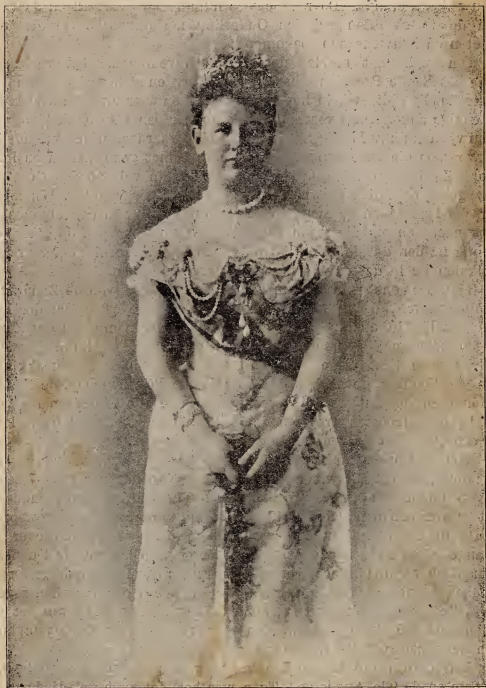
KONINGIN WILHELMINA DER NEDERLANDEN