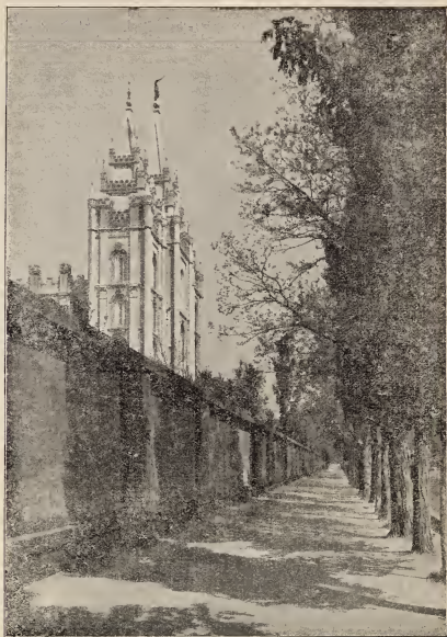
DE TEMPEL TE SALT LAKE CITY

DE TEMPEL. — Deze plaat geeft de drie naast elkander staande torens aan de voorzijde des Tempels te zien. De Tempel is een der eerste gebouwen, waaraan de Heiligen een begin maakten nadat zij in 1847 de vallei van het Groote Zoutmeer waren binnengekomen en die plaats hadden gekozen om er zich te vestigen. Brigham Young, de Mozes van het verdreven volk, had, op den dag van zijne aankomst met de pioniers, aangekondigd: „Hier zullen wij eene stad bouwen en den Heere eenen Tempel oprichten.” Op de aangeduide plek staat het