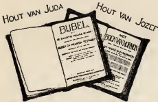
„EN ZU ZULLEN EEN WORDEN IN MIJNE HAND [ZECH. 37:19.

In dit jaar 1909 is het tachtig jaren geleden sedert het Boek van Mormon in Amerika uitgegeven werd, want dit had plaats in het jaar 1829, in den Staat New-York. Er is geen ander boek, de Bijbel uitgezonderd, dat zooveel bestreden is en dat van zooveel beteekenis is voor de wereld als dit boek. Het is eene vertaling van metalen