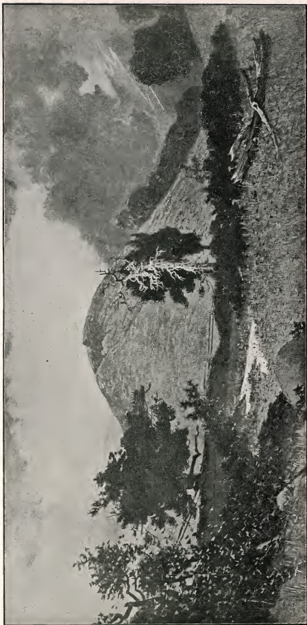
DE HEUVEL CUMORAH.