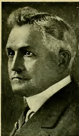
DAVID O. MCKAY, 2e Raadgever.

menging zou tegen de fundamentele voorschriften van het Evangelie zijn en tegen de leerstellingen en orde van de Kerk.