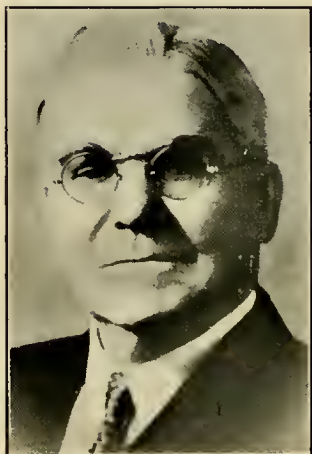
CHARLES A. CALLIS