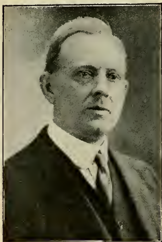
JOSEPH FIELDING SMITH