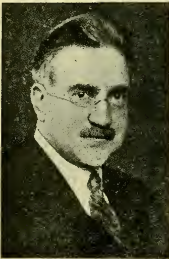
JOHN A. WIDTSOE