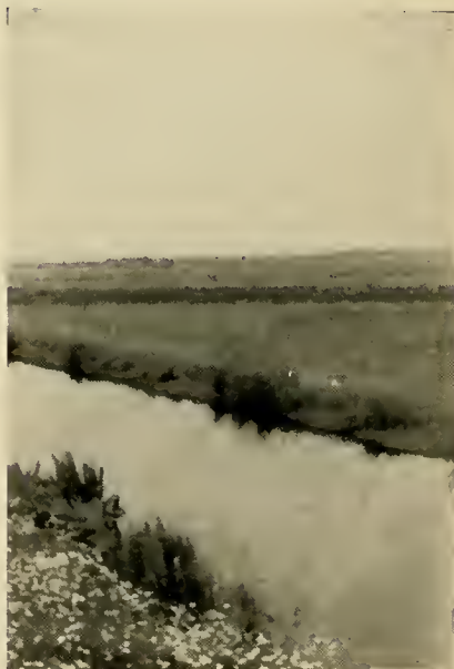
EERSTE DOOPPLAATS te Broek-Akkerwoude (Friesland).

Amsterdam kan op de eerste Nederlandsche Mormoonsche gemeente bogen. In later jaren zijn er meer malen twee Amsterdamsche gemeenten geweest. Ook Rotterdam heeft jaren gekend dat er zich aldaar twee gemeenten bevonden, zooals heden