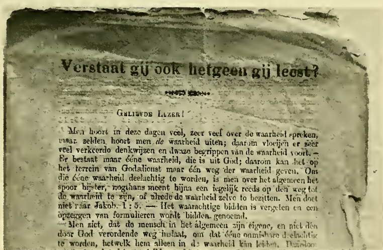
Reproductie van de inleiding der eerste tractaat in Nederland gedrukt — Juni 1866 te Amsterdam.

In den laatste tijd staan al deze afdelingen: Zondagsscholen, Zusters Hulpverenigingen, Jongemannen en Jongevrouwen O.O.V., de Genealogie en het Jeugdwerk onder een eigen, algemeen bestuur.