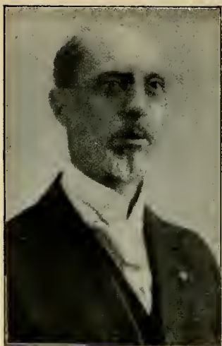
GEORGE ALBERT SMITH