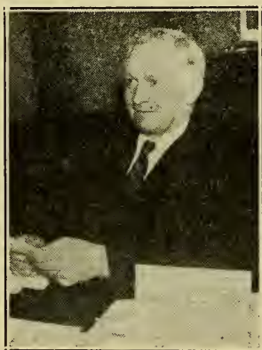
Werk brengt geluk . . .

Een voorname leer van de „Mormoonsche” Kerk is, dat een elk persoon deze verantwoording draagt en dat de zaligheid van den mensch een proces van voortdurende ontwikkeling is. De kerk aanvaardt niet de leerstelling, dat een louter gemompeld geloof in Jezus alles is, wat tot zaligheid noodzakelijk is. Een mensch kan zeggen, dat hij gelooft, doch indien hij niets doet, om dat geloof een beweegkracht te