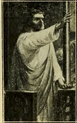
Paulus in de Synagoge Hij gaf een zaligheids-philosophie

Christus gelooft, heeft u zalig gemaakt, iets, dat Genade genoemd wordt, maakt u voortdurend en geheel en al zalig”. In werkelijkheid echter zeggen Paulus en Amulek: „Door de genade van Christus hebben wij het geloof, hetwelk ons zalig maakt; doch dit zaligmakend geloof is geen oogenblikkelijke houding, doch een voortdurend daadwerkelijk beginsel, hetwelk leidt tot stipte gehoorzaamheid aan de wetten en verordeningen van God en onophoudelijke rechtvaardigheid”.