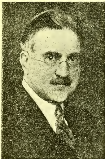
Dr. John A. Widtsoe

Ofschoon deze mannen niet langer leden der Kerk waren, hielden zij toch steeds vast aan de waarheid van hun getuigenis, zooals in het Boek van Mormon te vinden, en aan hun geloof in de goddelijkheid van de aan Joseph Smith, den profeet, gegeven openbaringen. Bovendien betrad Oliver Cowdery na enkele jaren weder nederig de wateren des doops en was op weg om met David Whitmer te pleiten voor zijn terugkeer tot de Kerk, toen de dood hem overviel. Beiden bevestigden met hun laatsten ademtucht de waarheid van hun getuigenis aangaande des Heeren werk in deze laatste dagen. Hun kennis aan-