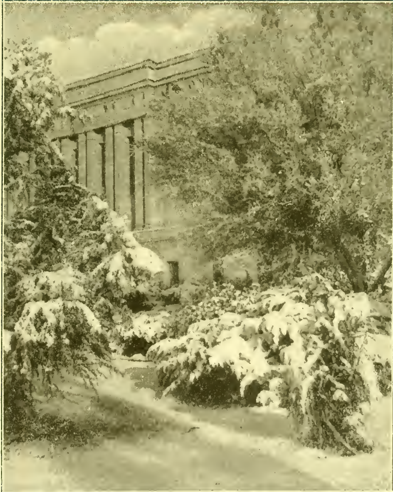
Wintergezicht Arizona Tempel