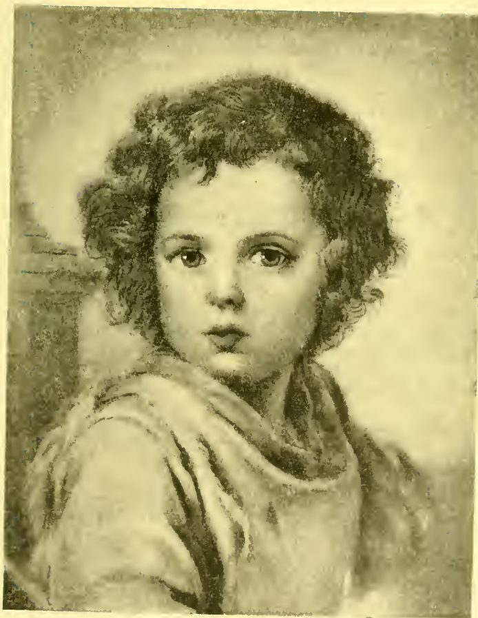
Het Christus-Kind (Zie blz. 425)