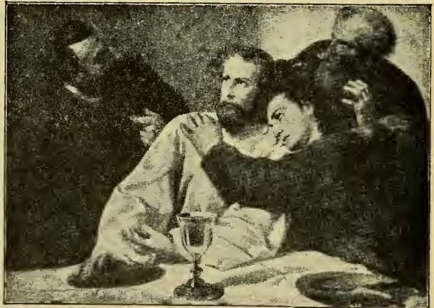
Judas verraadt Christus

Een dag of twee, nadat Christus Zijn Bergrede had uitgesproken, viel er iets voor, dat Zijn discipelen niet hadden verwacht. Er was een zondige vrouw, die geïnspireerd moet zijn geweest door Zijn woorden „Komt tot Mij, allen die vermoeid en belast zijt en Ik zal u rust geven”. Lukas zegt ons, dat Jezus tot een maaltijd