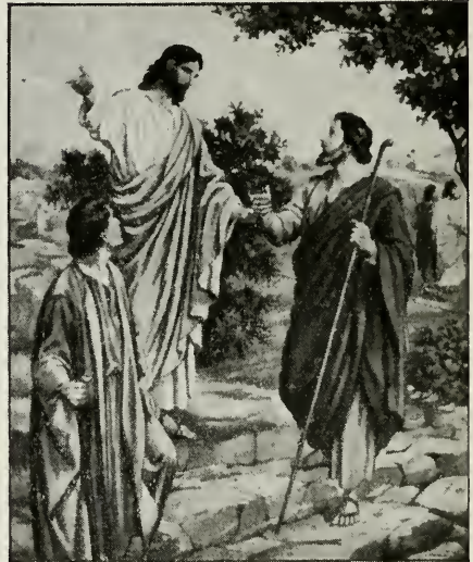
Het kiezen van de Twaalven

Voortdurende openbaring is juist zulk een kenmerk van de ware Kerk van Jezus Christus' als de