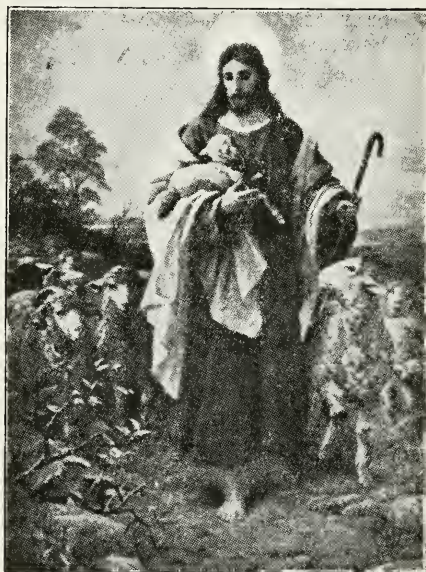
De Man van Galilea

ammed vertoonen allen in hun werken strijd en moeite, doch uit alhetgeen Jezus deed, blijkt geen spoor van strijd of pogen. Voor Hem waren er geen vraagstukken. Alle wetenschappelijke feiten vallen zeer gemakkelijk binnen Zijn verstandelijke sfeer. Nimmer was er een schaduw van twijfel of onzekerheid. Het is waar, dat Hij