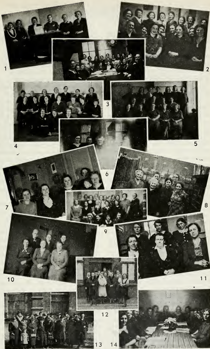
1 Delft. 2 Den Haag. 3 Utrecht. 4 Amsterdam. 5 Overmaas. 6 Gouda. 7 Leiden. 8 Haarlem. 9 Arnhem. 10 Schiedam. 11 Dordrecht. 12 Den Helder. 13 Rotterdam. 14 Groningen.