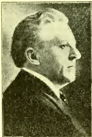
Oud. Melvin J. Ballard

I N HET begin der negentiende eeuw was godsdienst van veel meer belang in het leven der menschen dan heden het geval schijnt te zijn. De verslapping is in de kerk, de algemeene vergaderplaats van de gemeenschap. Vanwege de zoo weinig socialen uitweg scheen de seculaire godsdienst steeds meer te gaan wedijveren. Secte streed tegen secte. Des avonds werden geestelijke opwekkingsbijeenkomsten gehouden en de predikanten