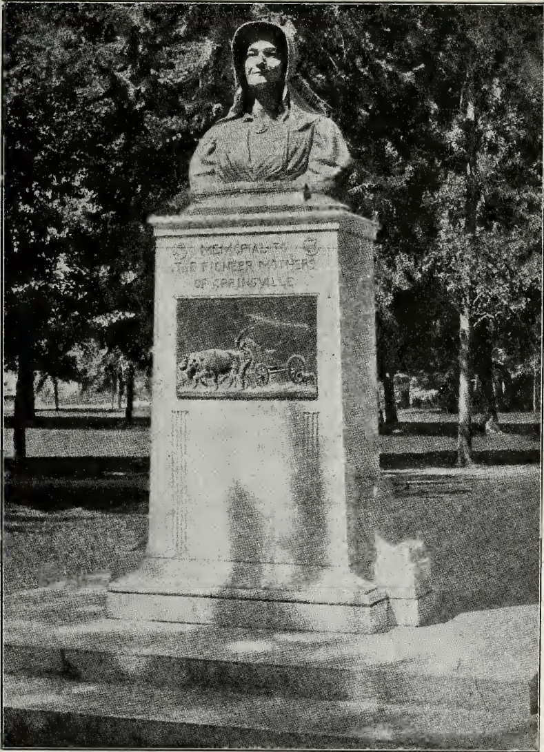
Monument ter nagedachtenis aan de Pioniermoeders (Zie blz. 141)