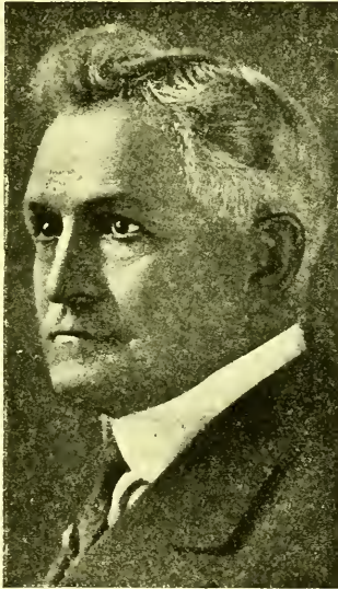
David O. Mackay

Tegenwoordig zweren de menschen bij de namen van heerschers: voor de Duitschers is het Hitler, voor de Italianen Mussolini, voor de Russen Stalin, voor de Spanjaarden Franco en voor de Chinezen Chiang-Kai-Shek. Aan elk dezer namen is een bepaalde regeeringsvorm verbonden en de aanhangers er van gelooven, dat hun redding, politiek gesproken, in het aanvaarden ligt van de theorieën, die door hun leiders worden verkondigd.