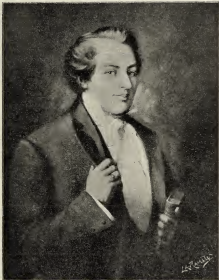
De Profeet Joseph Smith De eerste Profeet van de Kerk