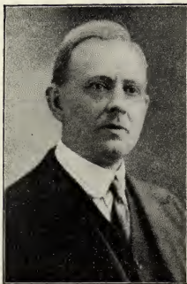
Joseph Fielding Smith

In vervulling van deze profetie heeft de Heere de Hemelen weer geopend en Zijn wil aan het mensdom bekend gemaakt. Hij heeft hemelsche boodschappers tot de menschen gezonden, om hun goddelijke volmacht en kracht te geven en hun het Heilige